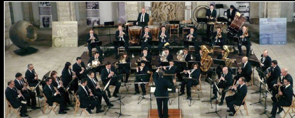
BANDA MUNICIPAL DE MÚSICA DE SANTANDER